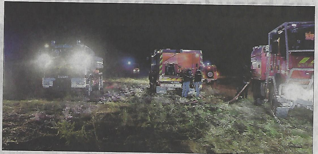
Une centaine de sapeurs-pompiers sont intervenus sur les lieux de l'incendie.

ronne. Au total, une centaine de soldats du feu sont intervenus sur les lieux. La RD334 a été fermée à la circulation. Par mesure de sécurité, le camping Les Armengauds a été évacué. En attendant que le feu soit fixé, la quarantaine de vacan-