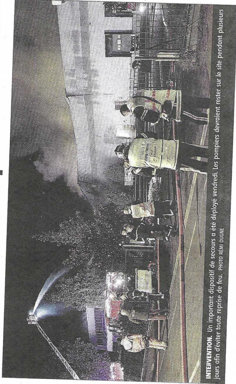
INTERVENTION. Un important dispositif de secours a été déployé vendredi. Les pompiers devaient rester sur le site pendant plusieurs jours, afin d'éviter toute reprise de feu.

Comme elle, ceux qui avaient l'habitude de passer les portes de l'entrepri-